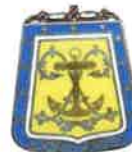
Amicale des Anciens du 6ème Hussards