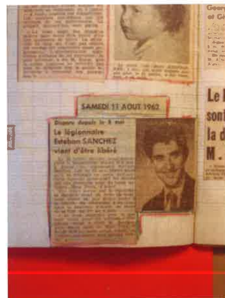
Article de presse conservé au SHD (1.H.1789).

En 2019, nous dévoilons pour la première fois le nom du légionnaire à l'association Soldis de recherche des militaires disparus en Algérie. Or, il n'apparaît pas dans ses recherches ; en effet Soldis nous communique une coupure de presse faisant part de sa libération dans la nuit du 1 er au 2 août 1962 dans « la banlieue d'Alger ». Nous évoquons en deuxième hypothèse cette ville comme un lieu probable de détention, car les geôliers parlaient de « Médéa et la Casbah ». Le timbre à moitié effacé, évoquait, par ses indications et sa forme, Alger Gare, le bureau du quai Warnier. De plus, on notait la ressemblance du témoignage du légionnaire avec celui d'une femme qui s'était échappée, le 28 mai, d'un lieu d'exsanguination à Alger. L'article n'évoque pas les circonstances de sa libération, soit par coup de force de l'armée (renseignement du 1 er août : la clinique de Saint-Eugène sert de lieu de détention d'Européens), soit par une libération négociée avec la Wilaya IV (20 Européens sont libérés le 3 août). Mais il est possible que cette libération s'inscrit dans celles du 3 août 1962.