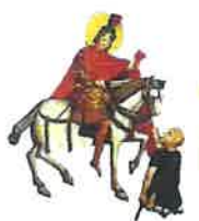
Secours de France