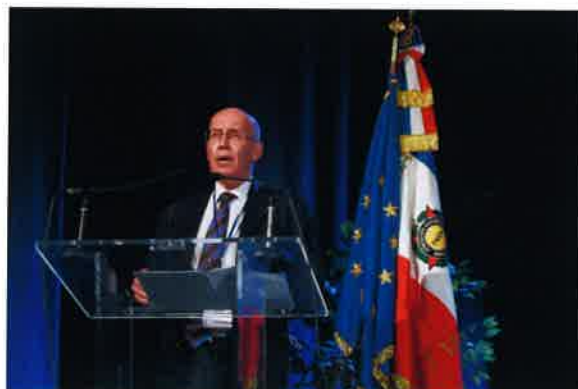
Intervention du général FOURNIER au congrès de la FNAM, le 14 octobre