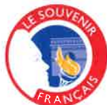
Souvenir Français (affilié)